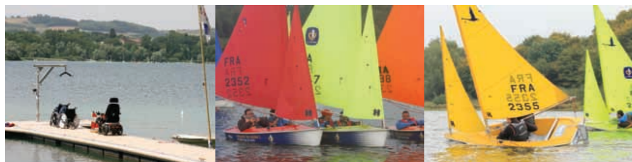
Personnes en situation de handicap physique ou sensoriel